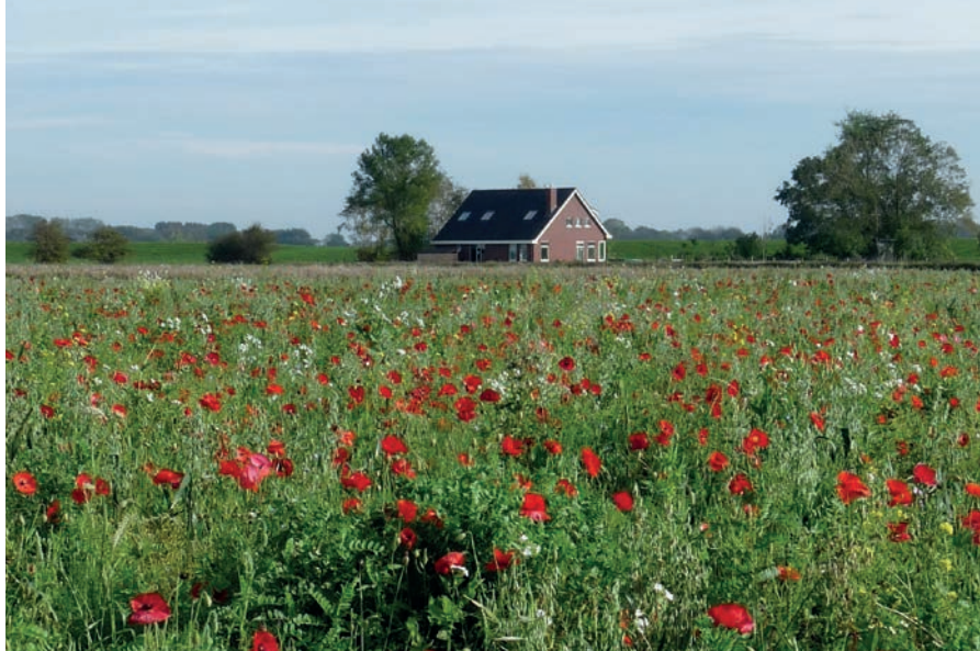
Vogeltjesland met ons huis in de Noordpolder

Toen ik hier weer kwam wonen, werd ik lid van Wierde en Dijk, niet gehinderd door enige kennis van wat dat eigenlijk voor vereniging was. Ik stelde me geloof ik een soort lokale afdeling van Het Groninger Landschap voor.